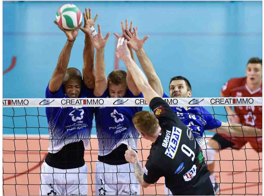
► Le MCVuc n'a pas raté ses débuts à domicile face à Narbonne.

► Ce samedi, 20 h, au palais des sports Chaban-Delmas de Castelnau-le-Lez, MCVuc - Nice VB.