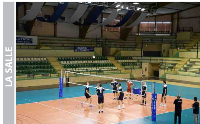
► Le palais des sports Chaban-Delmas, à Castelnau-le-Lez.